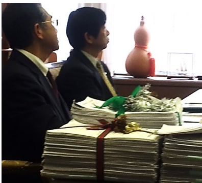
署名を受取り、話を聞く市長・教育長

「1回だけ大きいホールで説明会するけど、意見言っても同じですよ。修正案に市民・議会が賛成しなかったら、公立幼稚園がどうなっても知りませんよ」、って感じだろうか。とても威圧的なものを感じた。